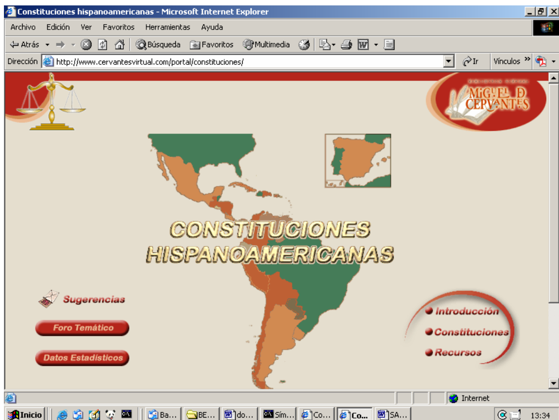
Página principal del portal