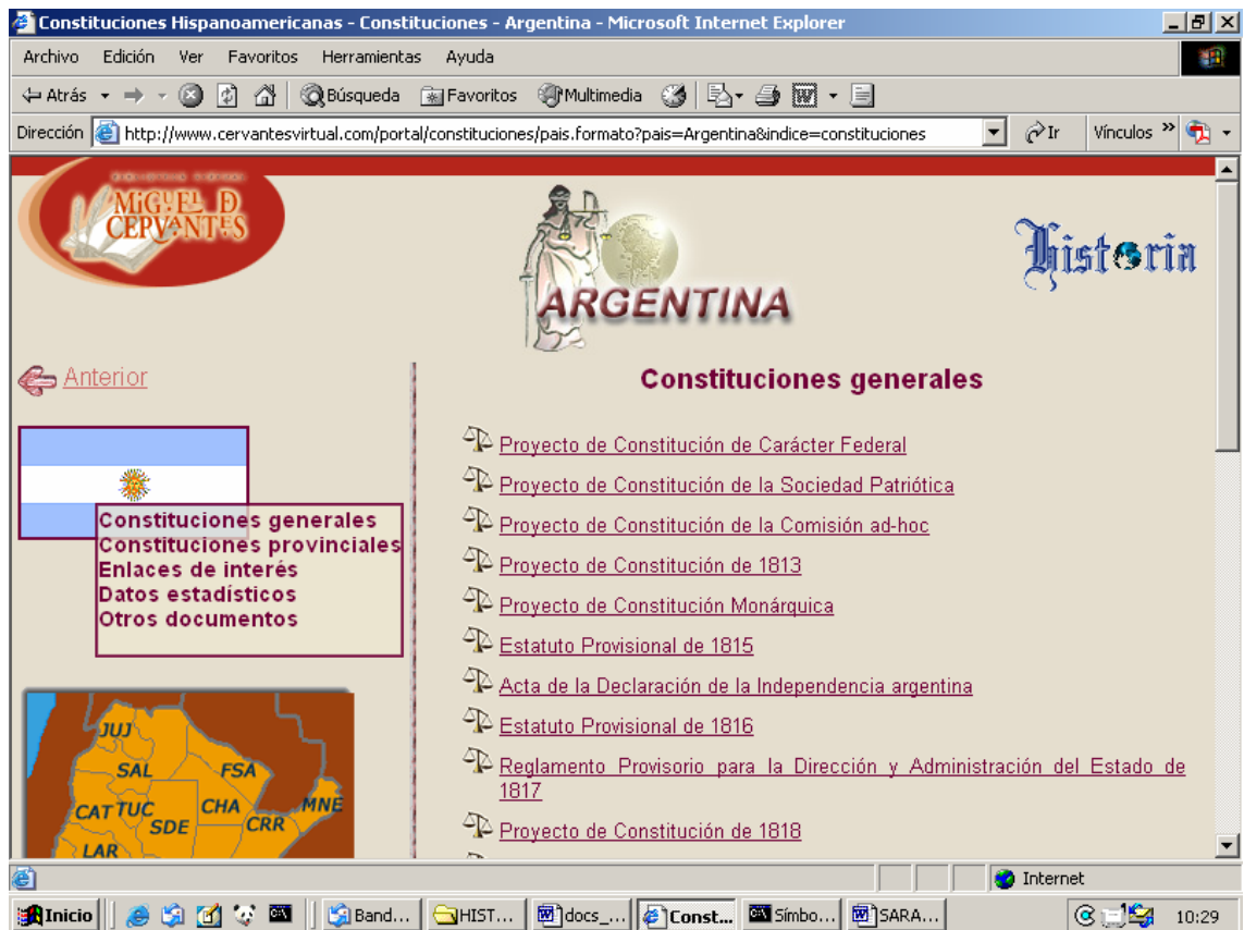
Página del apartado de Argentina